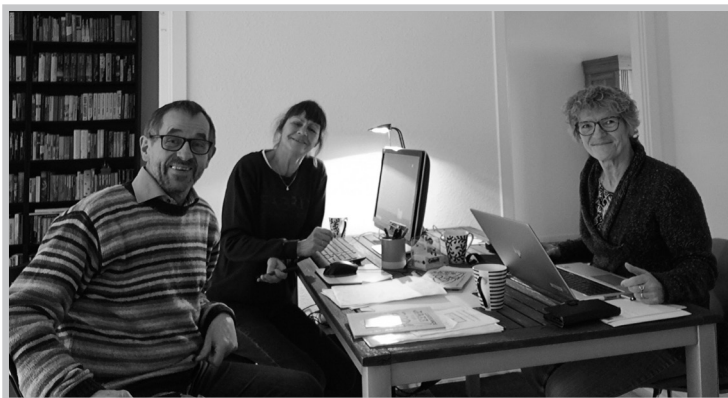
Redaktionen arbejder i "Bjergene"

DERFOR kære annoncører, mange mange mange tak.